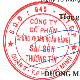
DƯƠNG MẠNH HÙNG