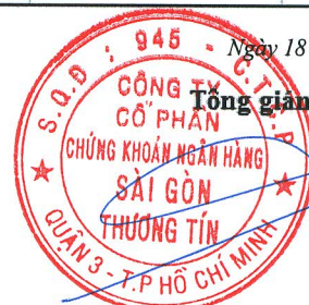
DƯƠNG MẠNH HÙNG